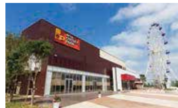
アウトレットパーク北陸小矢部